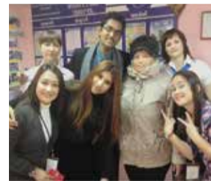
В гостях в офисе пос. Николаевка ЕАО

Стажировка продолжилась в Комсомольске-на-Амуре - городе основания КПК «Первый Дальневосточный». Гости посетили все пять офисов Комсомольского филиала.