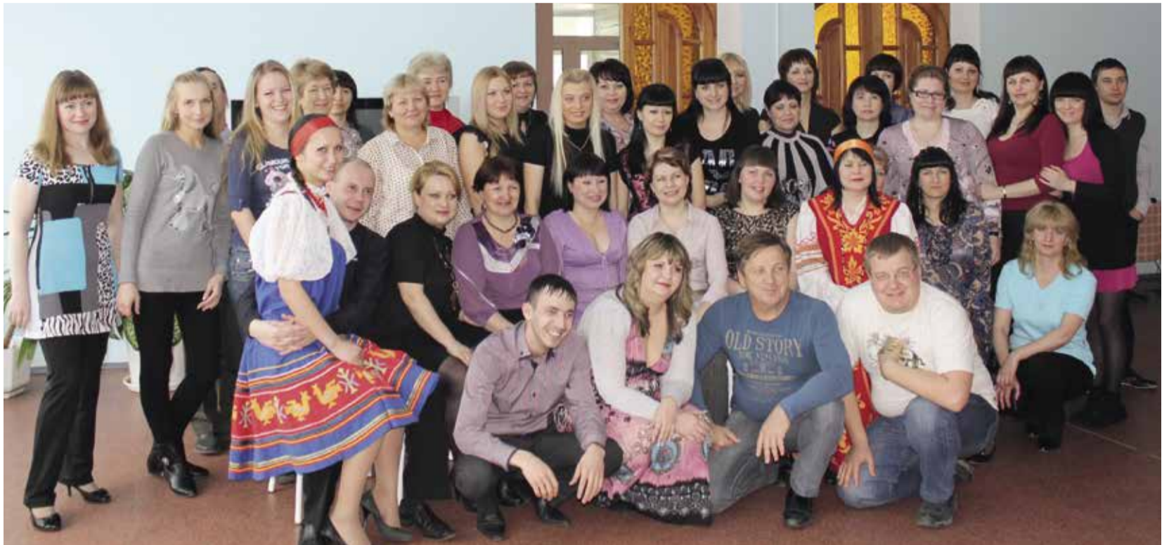
Коллектив КПК «Первый Дальневосточный», май 2013

Рост числа пайщиков, а также востребованность услуг кооператива послужила началом открытия новых офисов. Так, в 1999 году был открыт первый филиал в городе Хабаровске, а в 2004 году был открыт первый дополнительный