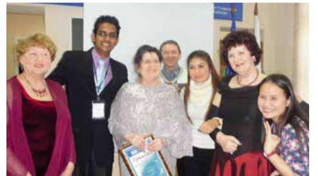
Награждение номинантов в конкурсе «Лучший пайщик», г. Комсомольск-на-Амуре

После Хабаровска гости посетили дополнительный офис №1 Биробиджанского филиала в п.Николаевка, где им был оказан душевный и радушный прием. Встречали по древней русской традиции «хлебом-солью». Сотрудники офиса рассказали о поселке, об истории офиса, своих достижениях. В рамках пребывания иностранных гостей в поселке состоялась «круглый стол» по вопросам развития и поддержки предпринимательства в поселке и ближайших населенных пунктах. В завершение гости побывали на концерт творческих коллективов дома культуры п.Николаевка. Приятным сюрпризом стали подарки и сувениры, изготовленные нашими пайщиками.